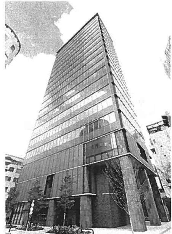
アーバンネット神田カンファレンス 外観