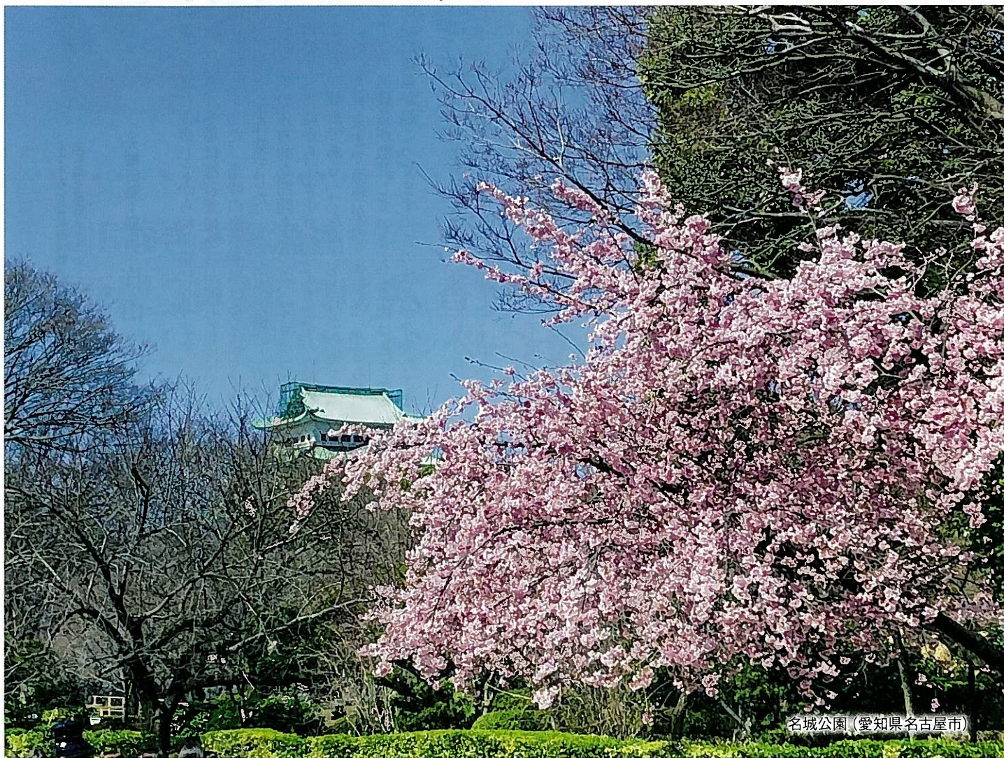
名城公園 (愛知県名古屋市)