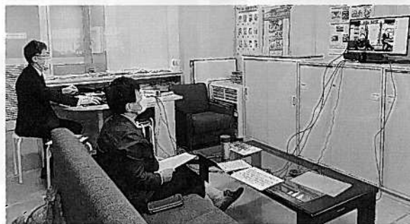
「農福連携を通して生協がどのような役割を果たせるか」話し合いました