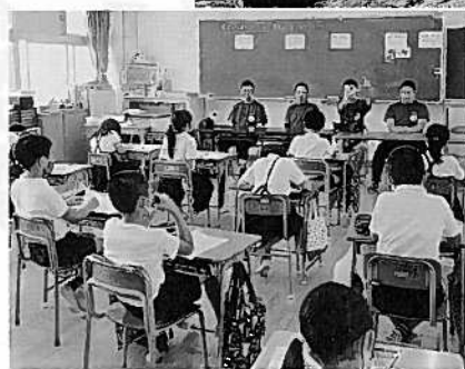
◀ゲストティーチャーとして授業を行う青壮年部員