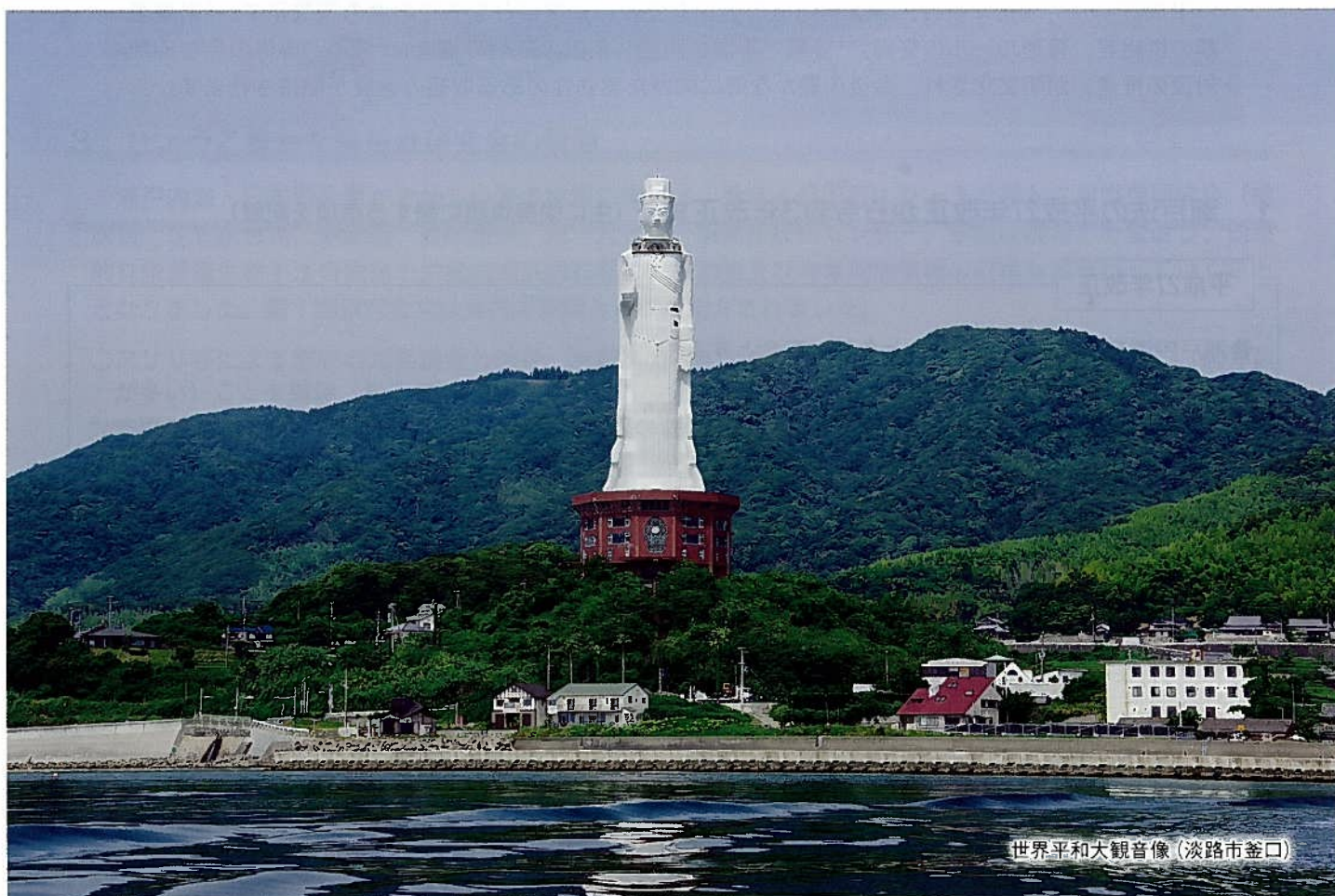
世界平和大観音像 (淡路市釜口)