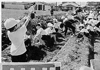
▶サツマイモの収穫を行う天満小学校1年生の皆さん

「学童農園」による『食農教育活動』や『農福連携』として地域に寄り添った活動を、今後も青壮年部とJA兵庫南が連携して実施していきます。