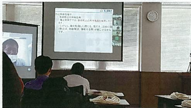
リモート講義の様子