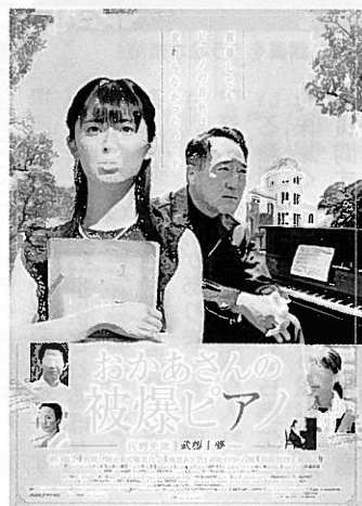
映画「おかあさんの被爆ピアノ」