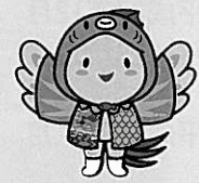
兵庫県マスコットキャラクター「はばたん」大会コスチュームデザイン