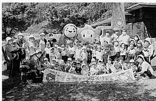
道の駅 みなみ波賀前

令和3年7月17日（土）に香美町の今子浦海水浴場において、香住区内の小学生40名が参加しヒラメの稚魚を放流、7月21日（水）には、中央市の道の駅みなみ波賀前において、波賀みどり保育園児46名が参加しあゆの稚魚が放流されました。 第41回 全国豊かな海づくり大会兵庫大会の開催日が令和4年11月13日（日）に決定するなど、今後も令和3年10月17日の大会1年前プレイベントをはじめ、大会開催に向け様々な関連行事が執り行われます。