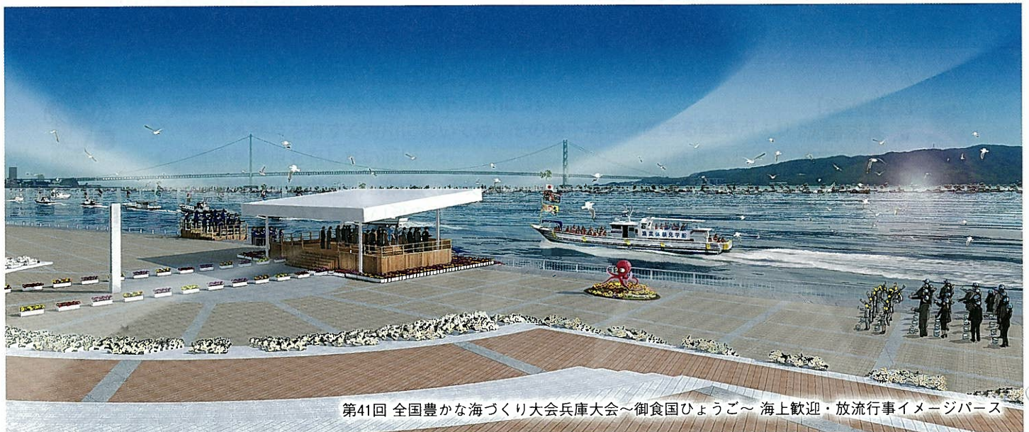
第41回 全国豊かな海づくり大会兵庫大会～御食国ひょうご～ 海上歓迎・放流行事イメージパース