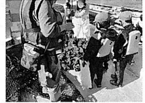
養殖カキ収穫体験