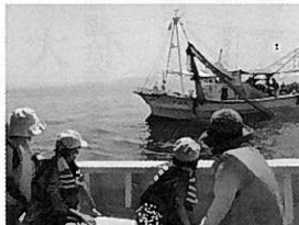
底びき網漁の見学