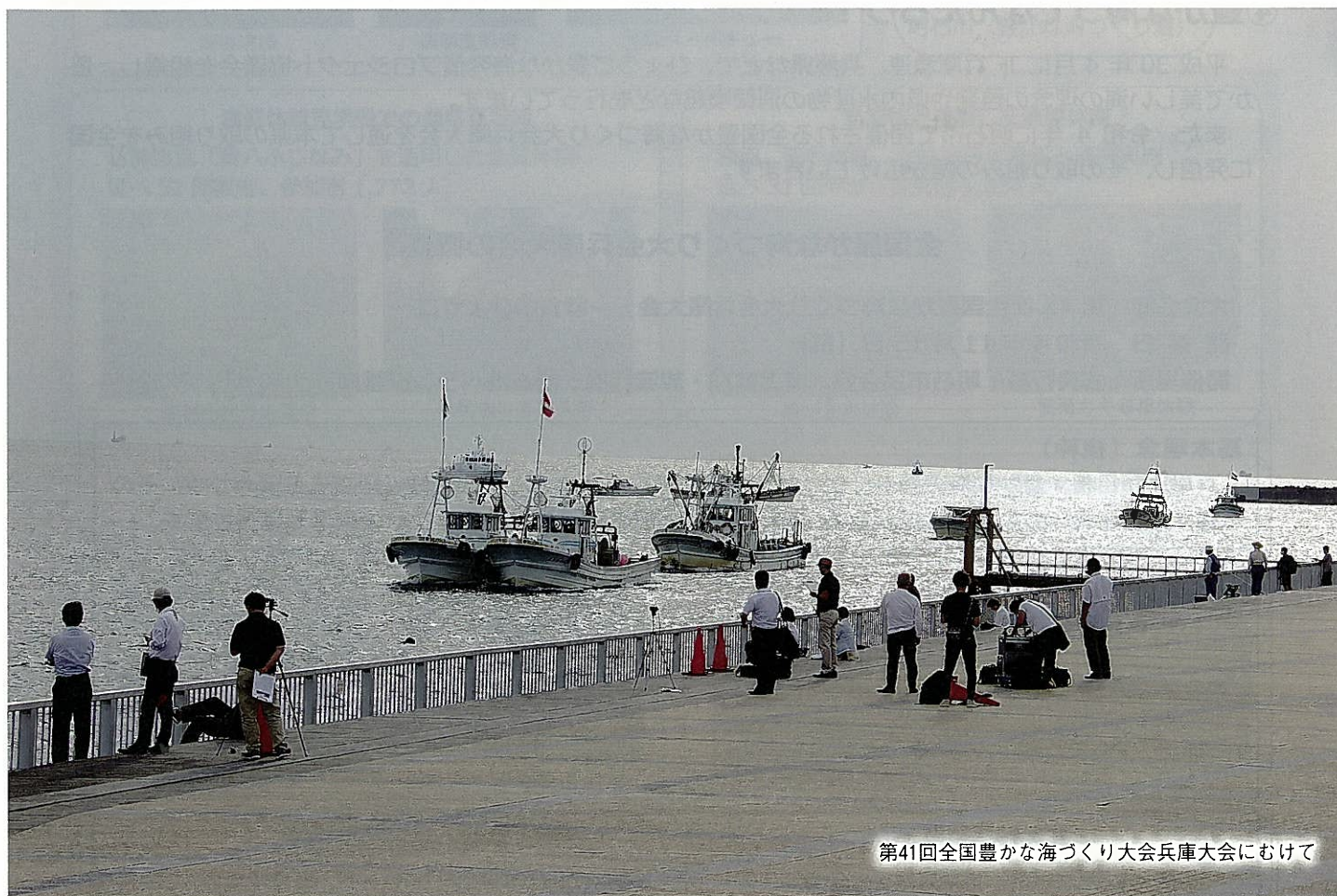
第41回全国豊かな海づくり大会兵庫大会にむけて