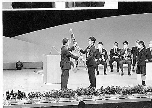
大会旗が齋藤知事に引き継がれる