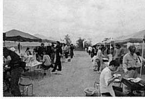
地魚バーベキュー