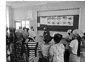
地魚の三枚おろしの実習