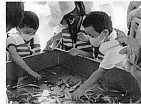
漁獲物の選別体験