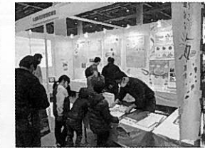
フィッシングショー OSAKA