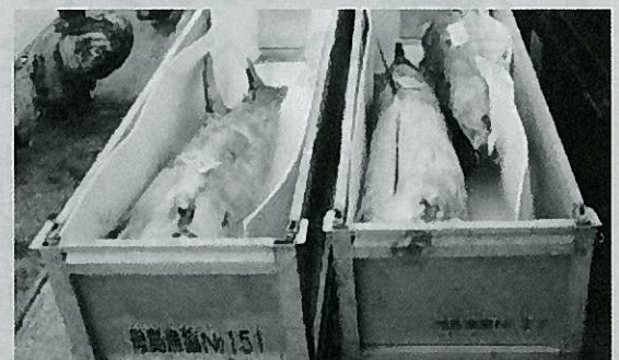
アルミ製魚箱とスチロール板

さらに、民宿の食事にも提供されるようになり、観光資源として活用され地域の観光業界の発展にも貢献した。こうして島内での消費量の拡大ができた。