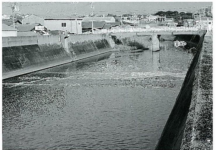
谷八木川における海水混合施設

大久保浄化センター(下水処理場)の排水が流される谷八木川の河口部で海水をくみ上げて混合させ、処理水を半分以下に希釈して海への影響を緩和させている。