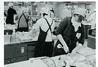
おんこう学生料理グランプリの様子