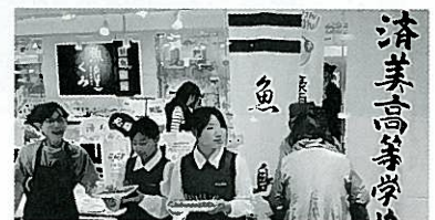
高校生と商品開発

漁協女性部が特産のタコをブランド化しようと、済美高校と協同し、「蛸としめじのアヒージョ」を商品化し、「The Wonder 500」に選定される。県内外で広く販売促進し、魚島の知名度が向上し、来訪者が増加した。