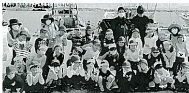
交流を深める漁師と園児

「カニ集会」はベニズワイガニの勉強会として、カニ(紙)芝居、茹でガニの実演、食べ方の動画視聴、試食を実施。「中野港沿岸漁師と園児の交流会」では小型底びき網の漁獲物水揚げ見学、魚の仕分けの体験、魚の方法の紙芝居、水揚げの様子を動画で視聴した。