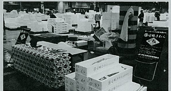
市場への売り込み