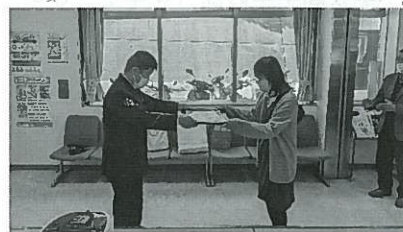
飾磨警察高山署長から感謝状が手渡される