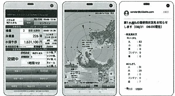
漁業操業支援アプリ

「下関おんこうフェア」「おんこう学生料理グランプリ」の開催、おんこう料理店マップの作成、高校生の調理実習への食材提供など幅広い内容の活動を展開し、地元の水産物の知名度アップに貢献した。