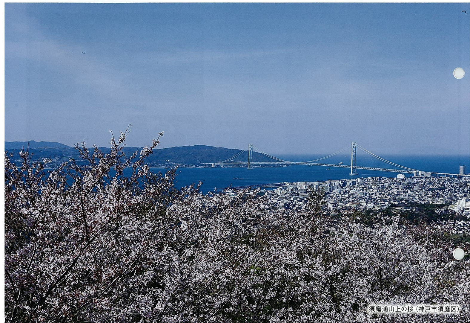
須磨浦山上の桜（神戸市須磨区）