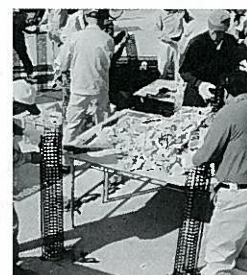
貝殻基質の製作の様子