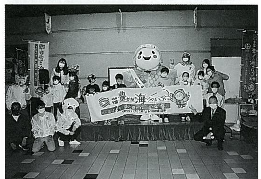
大会キャラクター「はばタン」と集合写真

3月27日(日)、神戸市立須磨海浜水族園で、令和4年11月に明石市で開催する「第41回全国豊かな海づくり大会兵庫大会(御食国ひょうご)」の大会テーマソング『いのちをつなぐ あお 碧い海』の完成記念イベントを行いました。