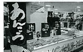
下関おんこうフェアの様子