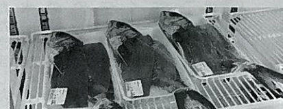
地魚を1次加工品して販売