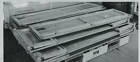
折りたたまれたアルミ製の魚箱