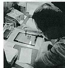
タブレットで入力