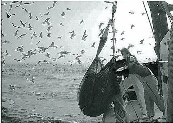
かつて瀬戸内海は宝の海だった(2012年6月) (瀬戸内海関係漁連・漁協連絡会議 発行)

また、明石市の下水処理場が30年あまりも目の前のノリ漁場との共存を図るため、様々な試行錯誤を経た栄養塩管理の先行事例を積み重ねてきた努力も、欠かせない取り組みで全国的にも注目されました。この中には、下水処理水の殺菌に使う塩素消毒が海の生物に悪影響を及ぼす可能性を軽減するための「海水混合」による排水の希釈措置や、大久保浄化センターの「紫外線滅菌処理」、そして二見浄化センターの「栄養塩管理運転」などがあり、継続した監視調査でモニタリングが重ねられてきたことも上げられます。