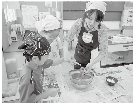
吸いつく吸盤を触ってみる…

9月25日(水)、26日(木)には、明石市立山手小学校の3年生(4クラス)を対象に「タコさばき