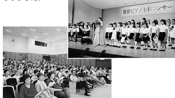
会場に平和を願う歌声が響きました

平和を祈り続ける被爆ピアノ。その美しい音色に、会場の参加者からは「毎日を平和に暮らすことの大切さを感じます」「今日一日感じるのではなく、後世に伝えなければいけないと思いました」という声が寄せられ、音楽を通して平和への想いをつなぐコンサートになりました。