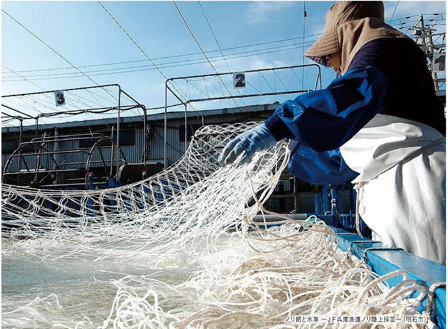
ノリ網と水車 ~JF兵庫漁連ノリ陸上採苗~ (明石市)