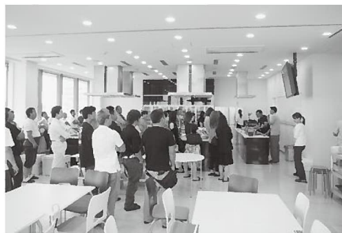
魚介類の下処理に女性参加者だけでなく男性参加者も興味津々

その後、参加者らが調理した料理を囲み、フリータイムスタート。今回は、料理と会話を楽しんでいたどころという思いもあり、敢えて、アトラクションは控え目に…。おいしい料理で話も弾み、見事7組のカップルが誕生しました。カップルが成立したみなさん、頑張ってください！