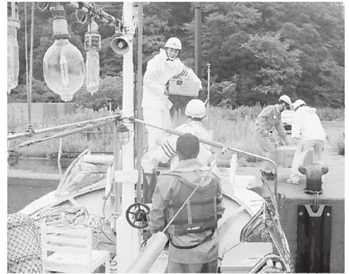
漁船に食料等を積み込む訓練の様子

守っていききたい」と話されました。なお、同町ではこの日、他の地区でも防災訓練が行われ、同地区を含む117で約8,000人が参加し、防災についての意識を新たにしました。