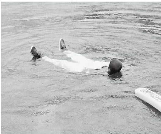
ライフジャケットの補助具として有効な浮力合羽

このあと、場所をJF荷さばき所に移し、ライフジャケットの実演を行いました。様々なライフジャケットを着用した同JF職員2名が飛び込むなか、同保安部担当者はそれぞれのライフジャケットの特徴を説明するとともに、JF兵庫漁連が開発した浮力合羽の紹介もされました。