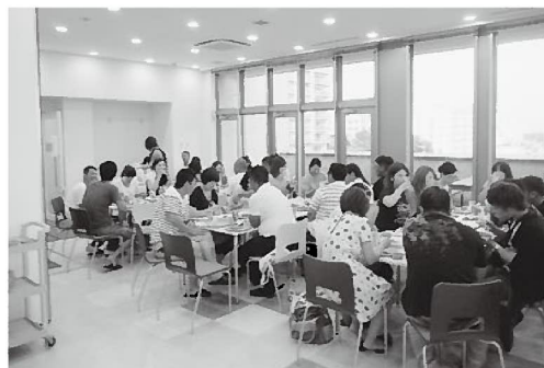
最初は緊張していた参加者も徐々にうちとけて…