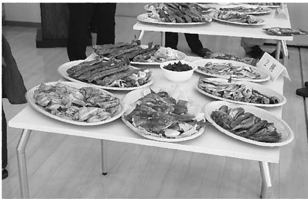
溢れんばかりの料理の数々

の人にも伝えたい」、「初めてハタハタを食べた」、「魚の種類を知らなかったので良い機会となった」などの意見があり、生産者側からは「皆さんに好評で嬉しい。このような交流会を持ってあげたい」、「今度は浜坂に来て、ぜひ味わってほしい」と応じ、旬の但馬の魚も満喫できた一日となりました。