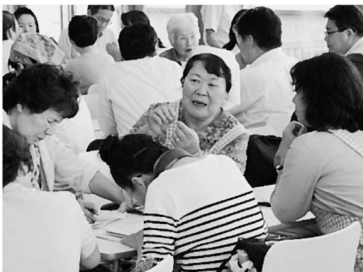
様々な内容で意見が交わされました

JF兵庫漁連では、今後もコープこうべとの連携を深め、県内産水産物の魅力を伝えるべく更に続けていきたいと考えています。この活動にご協力いただける漁協・青壮年部・女性部の方を募集しています。SEATER CLUB（TEL：078-917-4137）までご連絡をお待ちします。