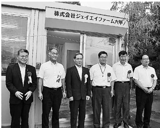
北畑代表理事組合長(左から3番目)ら (神戸市北区の事業所開業式にて)