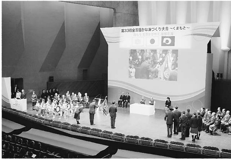
天皇・皇后両陛下ご臨席のもと開催されました

10月26日(土)、27日(日)の両日、「第33回全国豊かな海づくり大会ーくまもと」が熊本県内で開催され、同大会に併せた物産販売、企画展示、体験コーナーなどの関連行事も含め、約7万人の来場がありました。