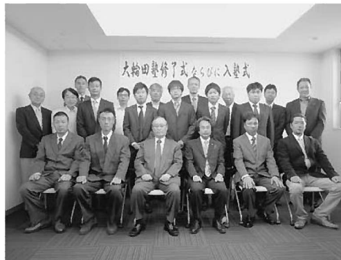
入塾生の記念撮影