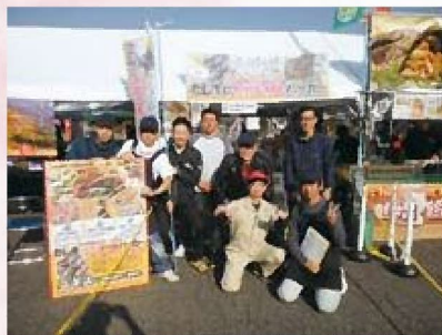
目標達成に笑顔のスタッフの皆さん