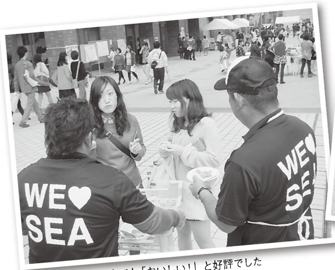
試食でも「おいしい!」と好評でした