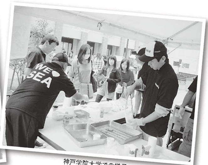
神戸学院大学での様子