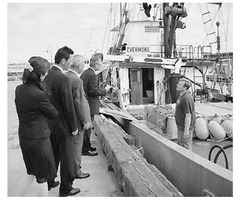
シアトルの漁港で地元漁師の話を聞く

友好提携50周年記念共同声明調印式は、19日午後、州都オリンピアの州議事堂上院議場で行われた。式辞で、インズリー州知事は、米国の州と日本の県の友好提携では最も歴史が長い関係を喜びとして「両県州は」文化・教育・商業など相互協力で恩恵を得ている。当時のロッセリーニ知事と金井知事は先見の明があった」と挨拶された。また、井戸知事は「18年前の阪神淡路大震災、12年前の米国同時多発テロ、2年前の東日本大震災など、大きな苦難に直面した両県州民は、お互いを支え合い、励まし合い、勇気づけ合ってきた。