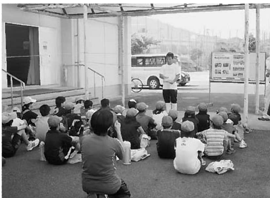
「食べる」ことについてしっかりと学びました！

新聞やテレビでも多数紹介してい だき、漁業士会や私たちの普及活動を 広く知ってもらうよい機会となり、あ りがたく思います。このような活動で、 子供に限らず多くの人が、自分たちで 水産物を調理し、味わうことを通して、 「あ、これおいしかったな」、「お、こ れ食べてみよう」、そんな気持ちにさ さやかな後押しをできれば良いと思 います。いつつ、これからも普及活動に努めて いきます。