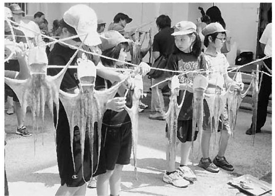
みんな、隣りの出来栄が気になります…

対象に行っている ものです。淡路の 漁業に関する講義 と干しダコ作りを 通して、地元漁業 や水産物について 学び、自分達の手 で実際に生き物を 調理して食べるこ とで、水産物のお いしさを知るとも に、「食べる」こ とについて考える ことを目的として 開催しています。