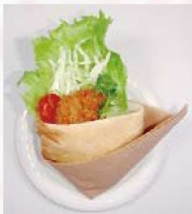
ニギスの知名度アップに期待