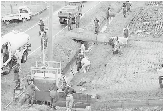
用水路では、池からの泥を流しつつ、魚を救出!

「かいぼり」はその後、洲本市でも予定されていることに加え、学校教育の場にも取り入れられるなど、淡路島全体の取り組みとして大きく発展しつつあり、今後の活動に期待が集まっています。