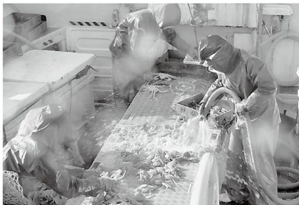
最高値更新となった浜坂漁港

初競りは同日午後から行われ、浜坂漁港ではこれまでの20万円を上回る、1匹25万円の最高値を記録し、柴山港では「松葉ガニ初せりまつり」が開催され、地元住民ら約3,000人がセコガニの味噌汁を味わうなど、各浜は初水揚げで活気に溢れました。