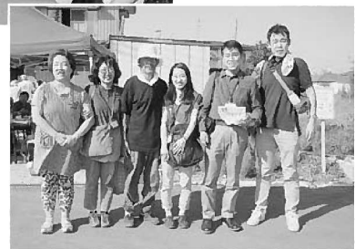
みやぎ県南医療生協の方々と一緒に活動しました