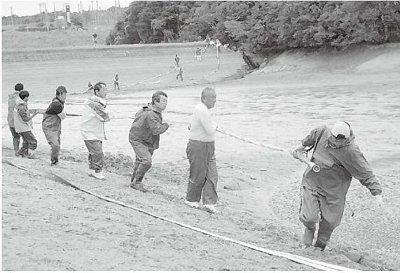
放水のため長いホースを引っ張る漁業者の皆さん