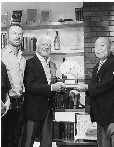
神戸ビーフの盾を手に記念撮影 (リカルド社長、エルミーニョ会長、平井副会長（左から）)

昨年2月以降、神戸ビーフはマカオ・香港・タイ・アメリカ・シンガポールの5カ国に輸出されており、今後、EUに進出することで、さらにブランド価値が高まることが期待されています。