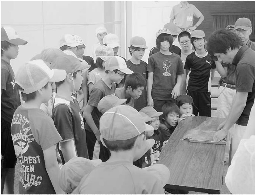
講師の手元に注目が集まります

ました。この活動は、同会の魚食普及活動の一環で淡路市、JF兵庫漁連、県立水産技術センター、洲本農林水産振興事務所が協力して、5年前から淡路市内の小学校を