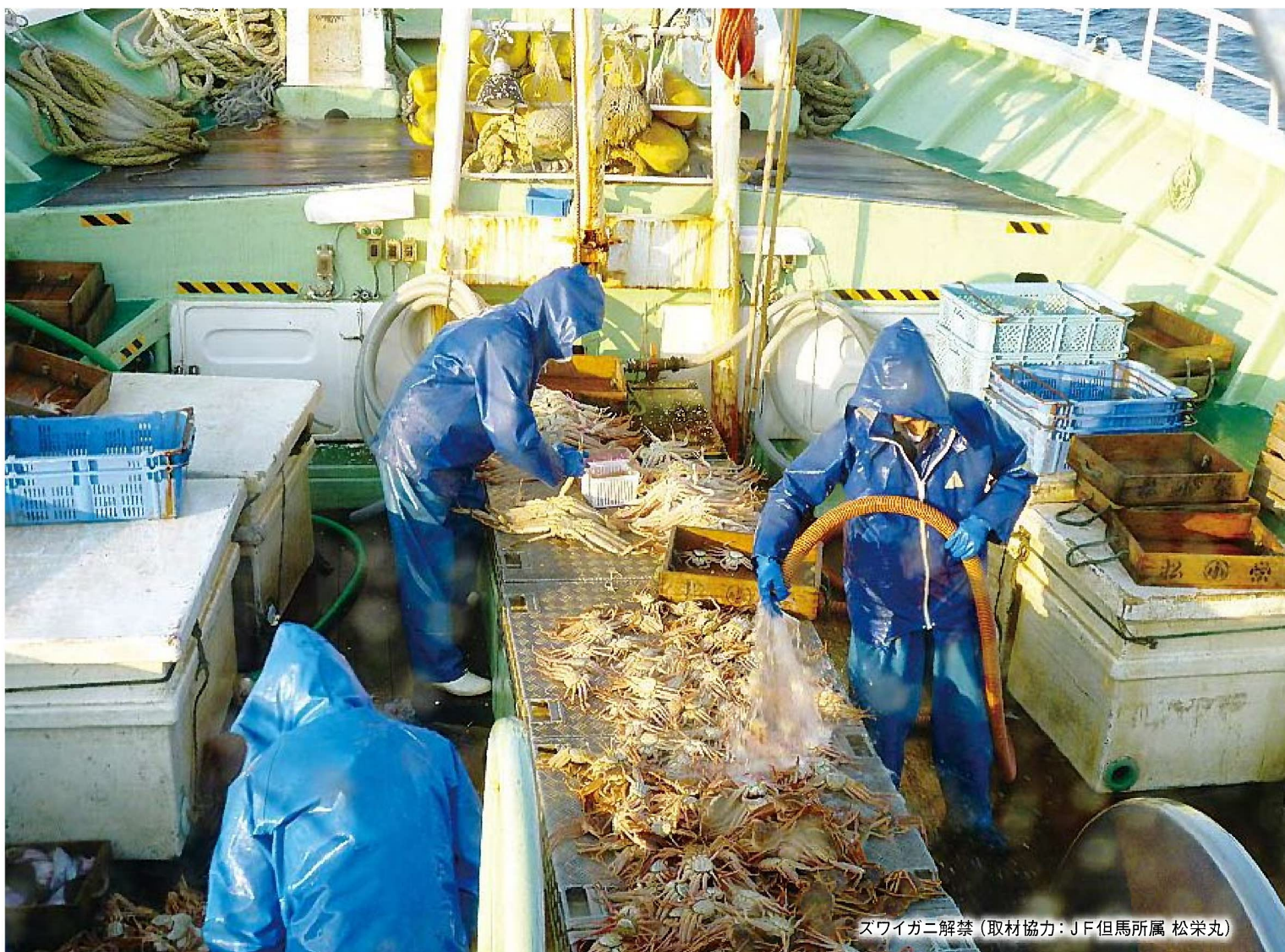
ズワイガニ解禁 (取材協力: JF但馬所属 松栄丸)