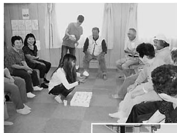
◀健康チェックの あとはミニゲーム を楽しみました

翌朝、山元町の旧JR山下駅、中浜小学校を視察。大阪きづがわ医療福祉生協の支援活動チームと合流し、各仮設住宅での健康チェック・体操・茶話会で活動しました。午後は山元町花釜地区の被災者宅に約40人が集合。みやぎ県南医療生協の「男の料理教室」に合流し、焼き秋刀魚などをいただきながら、震災当時のお話を伺いました。その後、仙台市若林区荒浜、名取市閑上を視察し帰途につきました。参加者からは、「浸水や塩害という被害もあり、現地の方が津波の被害を“水害”と表現されていたことが印象に残りました」「今まで気づかなかった問題や現状が分かり、これからの情報にも敏感になれる。これが“現地へ行く”意義だと思う」「『遠いところから来ていただき本当にありがたい』と言っていた、交流も十分支援になるのだと感じました」など、息の長い支援活動を継続することの大切さを実感しました。