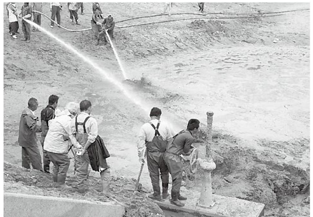
2mもの泥が堆積していました