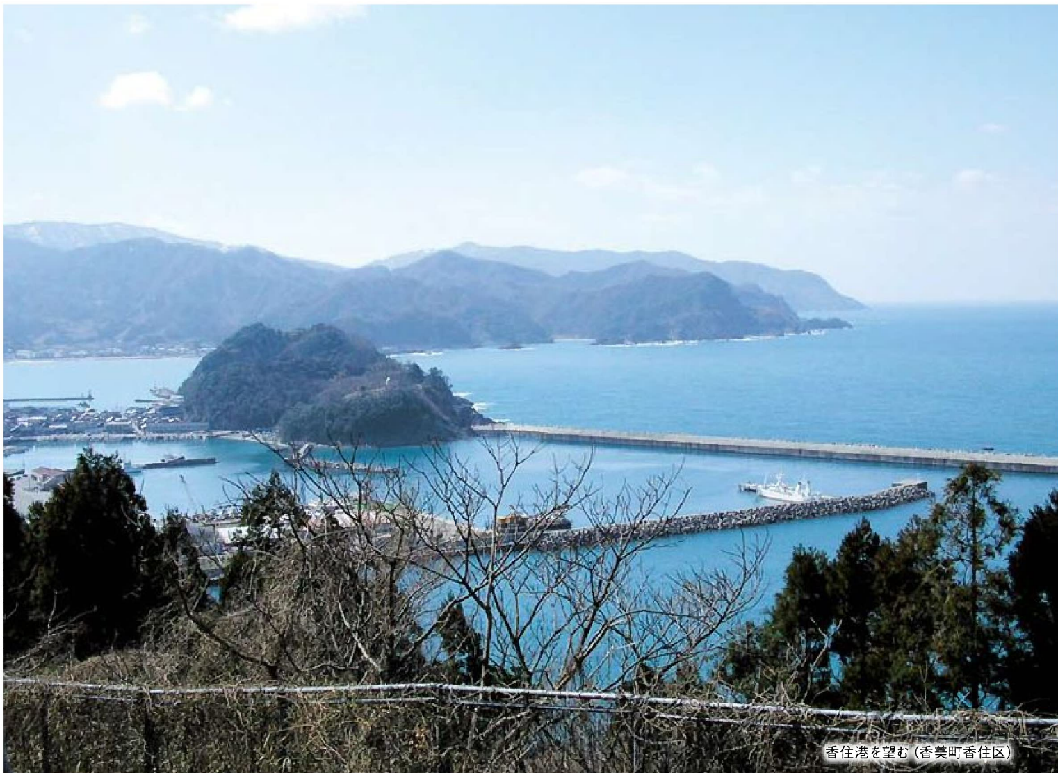
香住港を望む (香美町香住区)