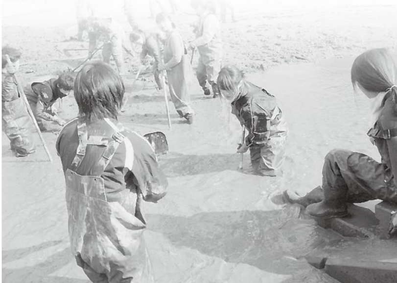
作業に参加してくれた龍谷大学の学生たち