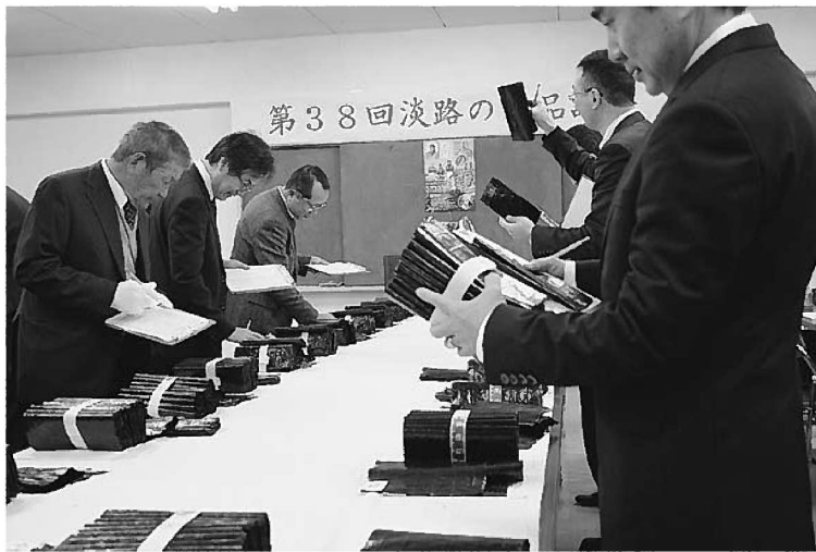
良質の淡路のりが並びました