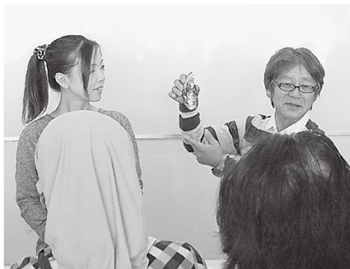
講師を務めた大河さんご夫妻

られました。JF兵庫漁連では、シートクラブでの料理教室を通じて県内産水産物の魅力を伝える活動を行っており、この活動にご協力いただけるJF・青壮年部・女性部の方を募集しています。興味のある方は、是非、JF兵庫漁連シートクラブ（TEL：078-917-4137）までご連絡下さい。