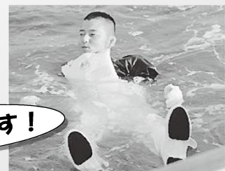
神戸海上保安部 海上保安官による実演

ライフジャケット・浮力合羽の購入は 所属JFかJF兵庫漁連資材部 (078-942-9272) までお問い合わせください