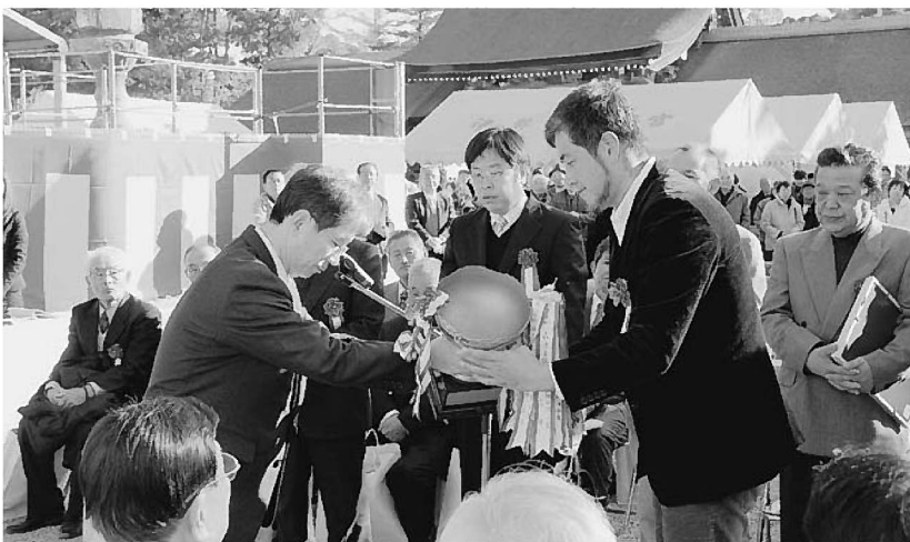
新平水産（右）の知事賞受賞の様子