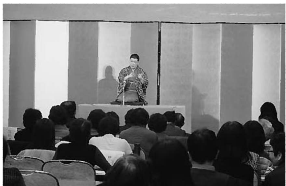
会場は笑いに包まれ楽しく学びました