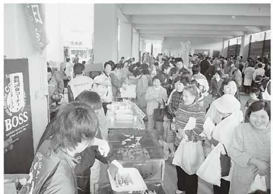
大勢の人で賑わいました

住水産加工業協同組合長一仁組合長は「とと条例の役割は、水産業復興・魚食普及・地域活性化の3つであり、今後は10名の精鋭部隊である、とと活隊と、町会議員や小売店、観光業者、一般町民からなる賛助隊員103名で、魚業の町、香住を盛り上げていきたい」と挨拶をされました。