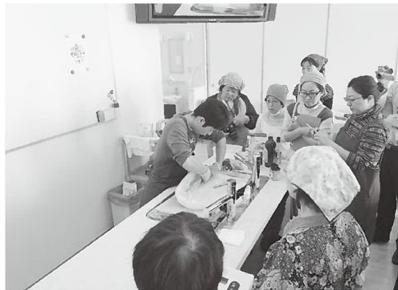
解体される大きなアカイカに注目が集まります

SEATER CLUBでは、今後もこのような兵庫の魚のおいしさや、楽しさを消費者へPRし魚食文化が継承され兵庫の魚の消費を拡大していく取り組みを企画して行きます。