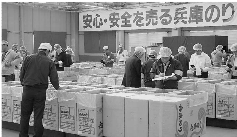
今年度最終共販・見付場の様子

ました。一部の地域では色落ちの影響があったものの、1月期の共販では上場枚数が2億枚を超える共販が開催され、概ね順調な生産が行われました。2月中旬以降には播磨灘全域で色落ちが発生し、その後大阪湾でも見られ、各地で減産・終漁が進みましたが、予定していた合計14回の共販（臨時共販を含め15回）を行うことが出来ました。