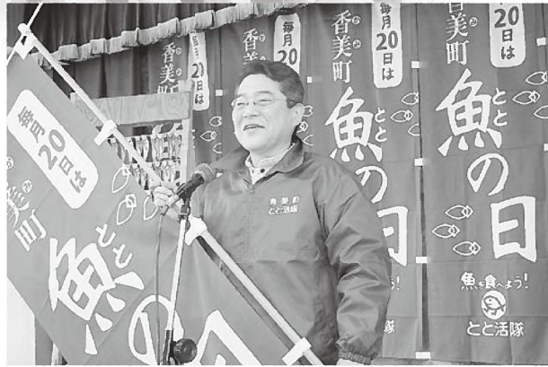
「とと活宣言」を行う浜上隊長