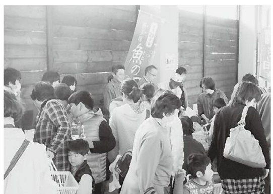
とと活隊のメンバーも参加