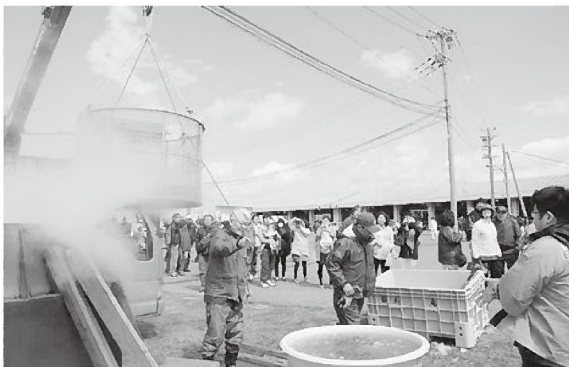
茹で上がったホタルイカに歓声が上がりました