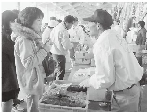
「浜ほたる」は人気でした！