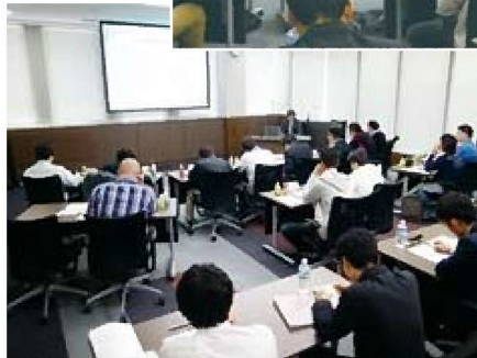
大勢の塾生が受講しました