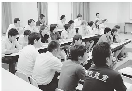
真剣な眼差しで講義を聴くゼミ生たち