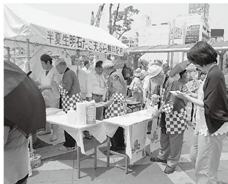
長蛇の列となったタコ料理の振る舞い