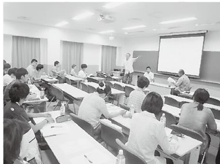
大角氏の講演の様子

学生の意見交換の場も設けられるなど、漁業についてしっかり話し合うことが出来た一日でした。