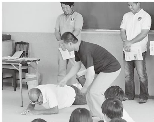
タコが疑似餌に飛び付く場面を再現!