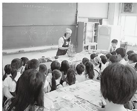
シートクラブの食育教室は明石市内各小学校で開催される