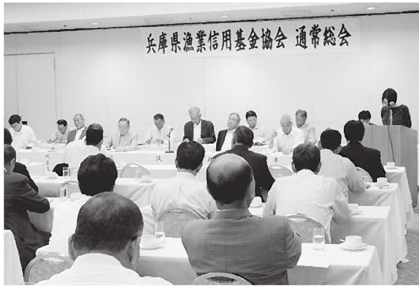
基金協会総会の様子