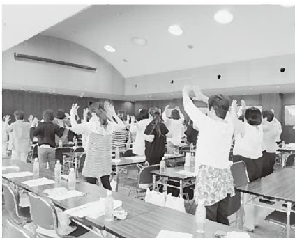
ストレッチでリフレッシュしました！

総会のあと、NPO法人あったか演劇研究会によ る「創造力をもっと豊かに！心と体のストレッチ」 と題した研修があり、講話のほか歌を聴いたり楽し く身体を動かし、心身ともにリフレッシュしまし た。心と体の健康を維持するために、豊かな食生活 が基本となることを再認識した部員たちは、今後の 魚食普及活動に、さらに自信を持って臨もうと決意 を新たにしました。