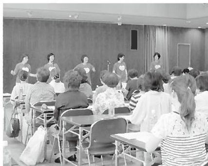
NPO法人あったか演劇研究会の講演