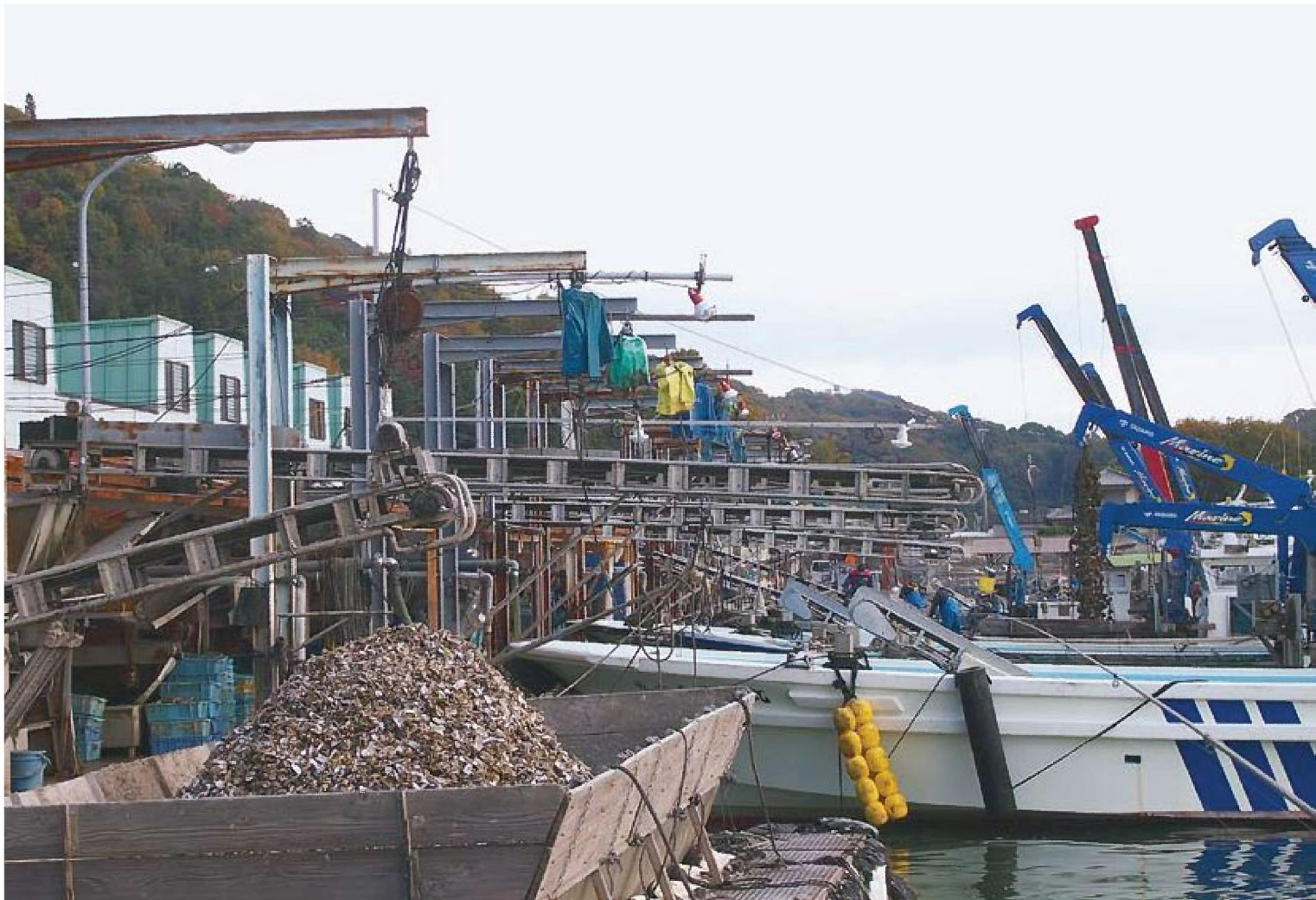
坂越港のカキ養殖 (赤穂市)