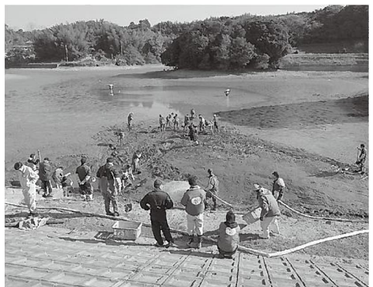
約10年ぶりのかいぼりとなった黒田池