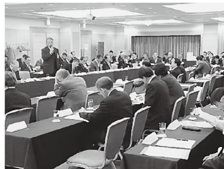
「一年牡蠣」について説明するJF赤穂市 大河組合長

F淡路島岩屋)、「秋の「もみじ鯛」(JF明石浦)、「冬の「一年牡蠣」(JF赤穂市)について、それぞれJF役員より説明・PRがありました。