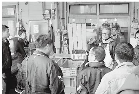
大河組合長から説明がありました

地では、大河組合長をはじめカキ生産者より説明があったほか、2班に分かれ、作業場へ向かい、カキの殻むき作業を見学しました。作業場には、女性を中心に大勢の人が座って作業をしており、殻をむく鮮やかな手つきを、多くの参加者が見入っていました。今漁期について、関係者は「現在のところやや小ぶりなものが多いが、今後、身入りは良くなってくるのでは」と期待を寄せていました。 見学後には、焼きガキを食べながらの情報交換会も行い、参加した皆様にはカキ養殖について学んで頂けたようでした。