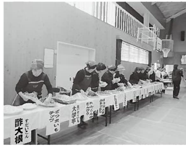
たくさん地元食材を使った料理が並びました カマスのみりん干しを切り分ける子どもたち