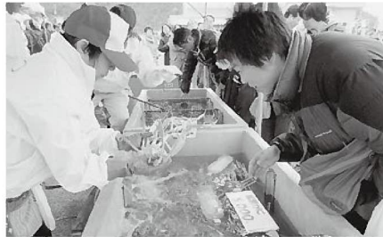
目利きを教わりながら買っていきます