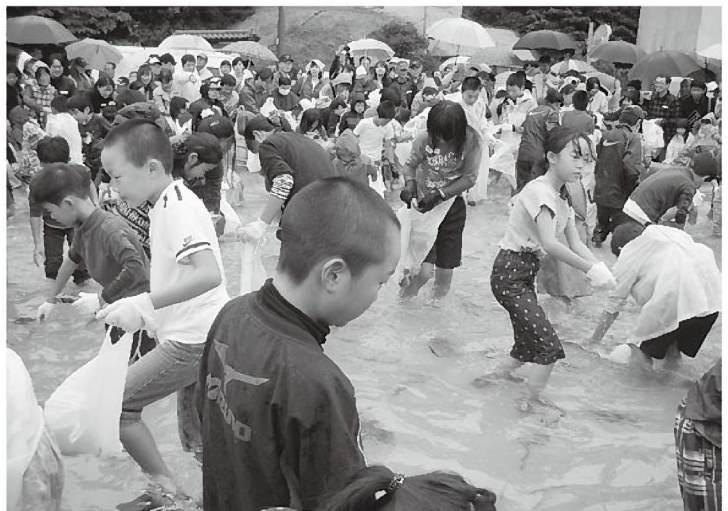
魚のつかみ取りは大人気でした

味噌汁」は絶妙の味わいで人気を集め、部長をはじめ役員、OBら8人が朝3時から準備したという370本の「アナきゅう巻」も早々に売り切れていました。なお、この巻き寿司用の卵焼きは、太巻き寿司で人気急上昇の八千代町生改グループに研修に行き技術を学んできたものとのことです。隣の鮮魚販売コーナーも女性部員の明るい呼び込みで殆どを売り切られるなど活況を呈していました。来場者の中にはカキを食べに同港を訪れて室津の魅力を知り、今回の祭りもネットで見て楽しみにして来たという人も多く、これから最盛期を迎える西播地域のカキ生産が「カキ街道」ブランドとともに、地域活性の核として地歩を固めつつあります。