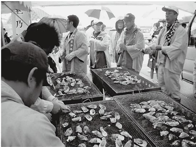
最盛期を迎えるカキをPR

水の中でマダイ、タコ、穴子、ガザミなどと格闘していました。このつかみ取りに参加するため岡山から駆けつけたという若夫婦は、合図の笛を待つ間「あのタイをつかまえてね」「エイなんか追うなよ」「両手を使えよ」と小5の男の子に細かい指示。親とのチームワークよろしく、この子は唇を青くしながらタイ2匹とスズキを捕まえました。模擬店では、漁協女性部が振る舞う「ガザミ