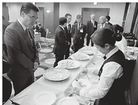
会場での試食の様子