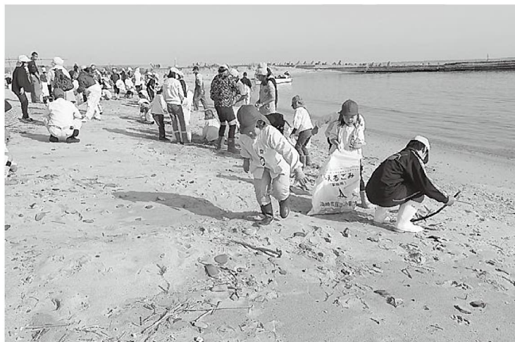
みんなのお陰できれいになりました!

立仮屋保育園の園児と同市立学習小学校6年生の児童ら約90名。はじめに、小学生と園児がペアになって砂浜のゴミ拾いを行いました。相田部長から「ガラスには気を付けるように」と注意を受けた子どもたちは、さっそく砂浜へ行き、楽しそうにゴミを拾っていました。 続く地曳網体験では、同部員らが網を仕掛ける様子を食い入るように見ていた子どもたちの期待は高まります。準備が出来たところで、大漁を願いながら、同部員らも入って「よいしょ、よいしょ」の掛け声を掛け、力を合わせて網を引き上げます。魚が浜に上がった時には走って