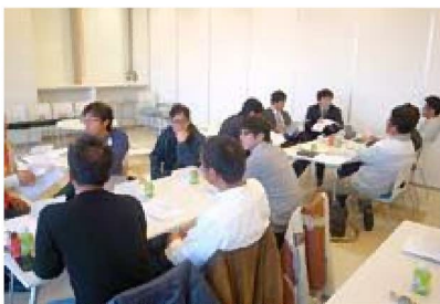
講義後、塾生間で意見を交わしてから質問します