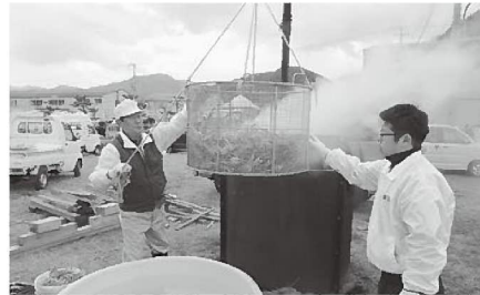
セコガニの大釜ゆでも大人気

特設コーナーでは、生きたカニを目の前で捌いて、刺身や、焼きガニ、茹でガニにしてももらえるとあって、長い行列が出来ました。他にも無料セコガニ汁や、カニクリームコロッケ、セコガニ飯なども人気で、カニの美味しさを十分に堪能してもらえたようです。また、松葉ガニやセコガニの目利きを漁協職員らが教えながらの販売や、クレーンを使って大量のセコガニを茹でる「大釜ゆで即売コーナー」も、新鮮なものが市価より安いとあって、次々に買って頂きました。他にも、セコガニ釣り大会やクイズなどの催しも多数行い、来場者の皆さんには楽しんで頂けたと思います。