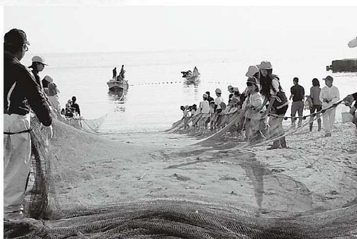
何が獲れるのか楽しみです

立仮屋保育園の園児と同市立学習小学校6年生の児童ら約90名。はじめに、小学生と園児がペアになって砂浜のゴミ拾いを行いました。相田部長から「ガラスには気を付けるように」と注意を受けた子どもたちは、さっそく砂浜へ行き、楽しそうにゴミを拾っていました。 続く地曳網体験では、同部員らが網を仕掛ける様子を食い入るように見ていた子どもたちの期待は高まります。準備が出来たところで、大漁を願いながら、同部員らも入って「よいしょ、よいしょ」の掛け声を掛け、力を合わせて網を引き上げます。魚が浜に上がった時には走って