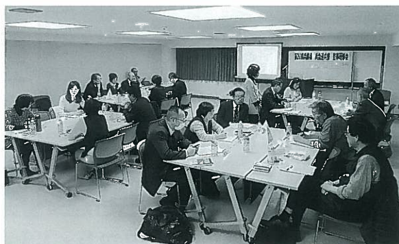
グループディスカッション