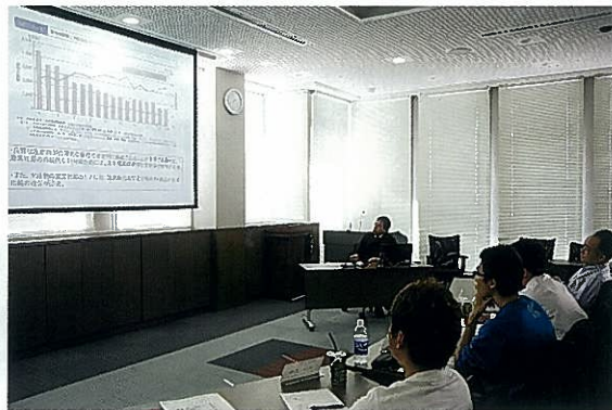
資源管理型漁業についての講義の様子