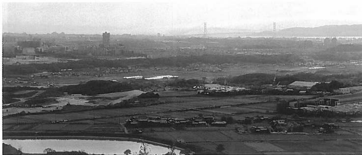
神出神社からの景色 西神・明石海峡・淡路島が一望

この後の昼食は、兵庫のりを使った巻き寿司、カキの味噌汁等が振る舞われ、同じ班のメンバーと楽しい昼食の時間を過ごしました。森の中で、木を切るという作業なので、すがた、たいへん、おもしろい、という感想が多く、何度も繰り返しご参加頂いている方が多い活動です。皆様も一度、是非参加してみてください。 作業について指導員の方から説明を受けた後、参加者は周囲に気を配りながら、広葉樹や花の咲く樹を残し、常緑樹や蔓性の植物を次々に除伐し、クマザサなどの下草も刈り取りました。約2時間の作業を終えると、地面を覆っていたクマザサも無くなり、太陽の光が差し込み、見通しの利くきれいな森になりました。作業を行った皆さんは「目に見えて日が差し込むようになった」と嬉しそうに話していました。