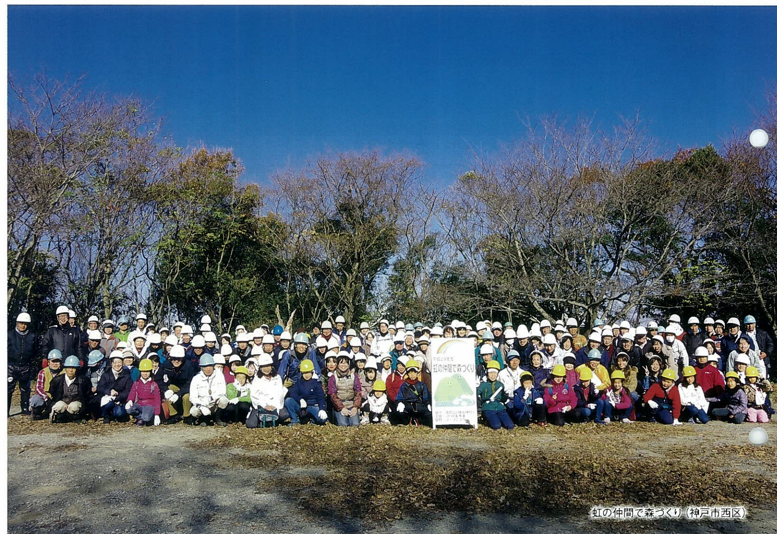
虹の仲間であそび (神戸市西区)