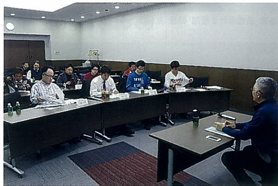
兵庫県の水産業について講義の様子

塾生からは、資源管理について現場からの意見が述べられるなど、活発な意見交換が行われました。