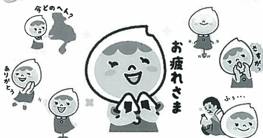
きぬこちゃんのLINEスタンプ