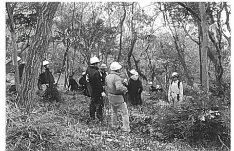
作業後の森 明るくなりました

この後の昼食は、兵庫のりを使った巻き寿司、カキの味噌汁等が振る舞われ、同じ班のメンバーと楽しい昼食の時間を過ごしました。森の中で、木を切るという作業なので、すがた、たいへん、おもしろい、という感想が多く、何度も繰り返しご参加頂いている方が多い活動です。皆様も一度、是非参加してみてください。 作業について指導員の方から説明を受けた後、参加者は周囲に気を配りながら、広葉樹や花の咲く樹を残し、常緑樹や蔓性の植物を次々に除伐し、クマザサなどの下草も刈り取りました。約2時間の作業を終えると、地面を覆っていたクマザサも無くなり、太陽の光が差し込み、見通しの利くきれいな森になりました。作業を行った皆さんは「目に見えて日が差し込むようになった」と嬉しそうに話していました。