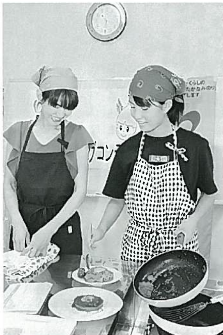
自ら考えたタマネギ料理を調理する参加者

また、8月には、消費拡大と次世代組合員との関係強化を目的にして、タマネギをテーマとした親子クッキングコンテストを開きました。書類審査を通過した4組の親子がタマネギ料理を披露しました。同JAは「コンテストをすることで、地域の皆様に地元でタマネギが生産されていることを知ってもらい、タマネギの消費を増やし、農家の所得増大につなげていきたい」と話しています。