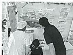
兵庫県民農林漁業祭