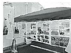
かすみ松葉がにまつり