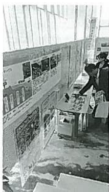
2018ため池フォーラム in ひょうご