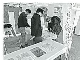
第52回 みのりの祭典