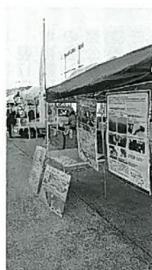
淡路島3年とらふぐ祭