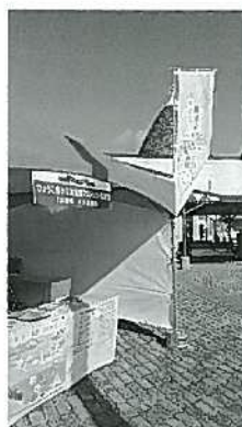
食のブランド「淡路島」 オータムメッセ2018