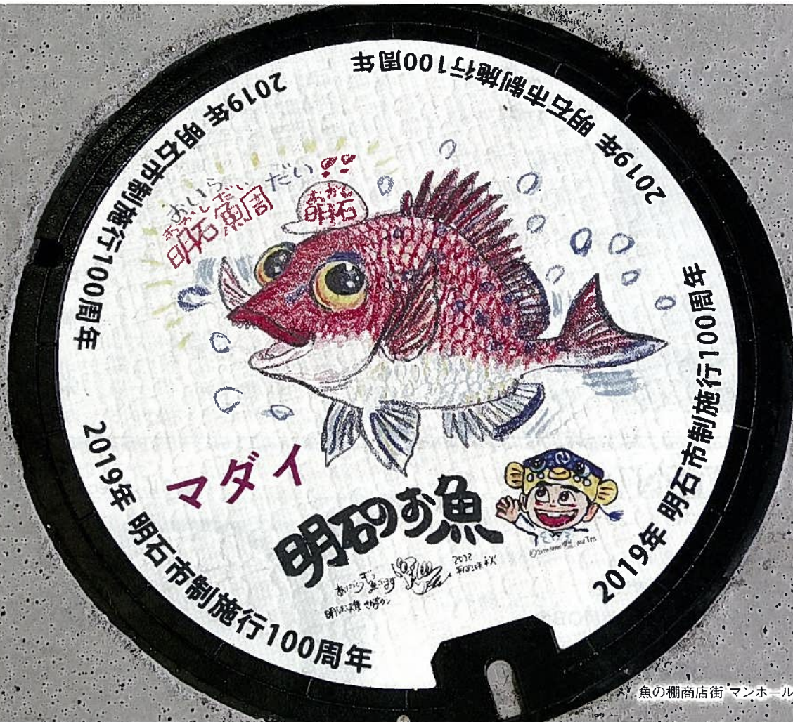
魚の棚商店街 マンホールのふた (明石市)