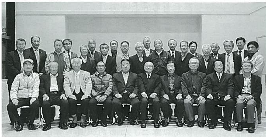
参加者全員での記念撮影