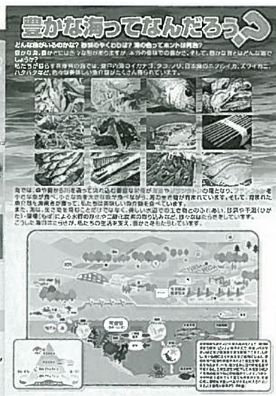
ひょうご豊かな海発信プロジェクト パートナーイベント 参加状況一覧表