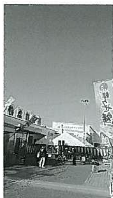
家島・坊勢とれとれ祭り、 ぼうぜ鯖祭り