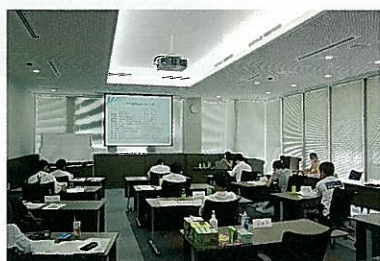
7月21日の講義の様子