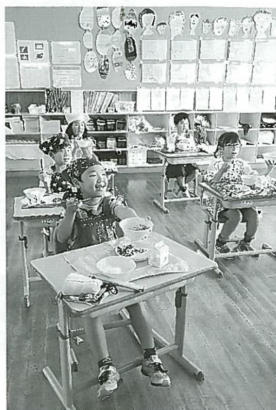
楽しく給食を食べる児童たち

市の担当者は「児童や生徒にとって大きな楽しみである学校給食へ良質な地元産食材を提供してもらい、ありがたい。特に今年は新型コロナウイルス感染症の影響で大変な思いをしたので、美味