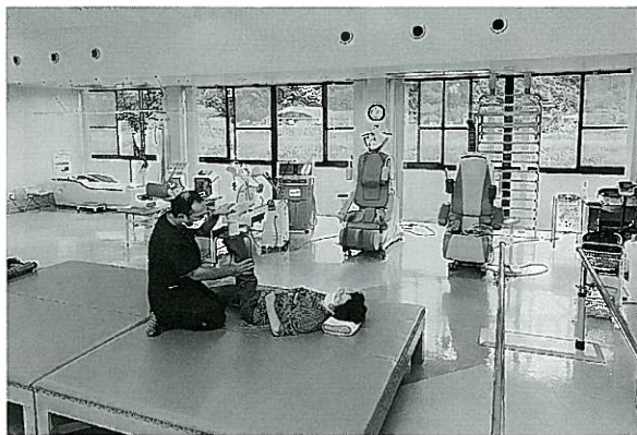
診療所内のリハビリテーション施設