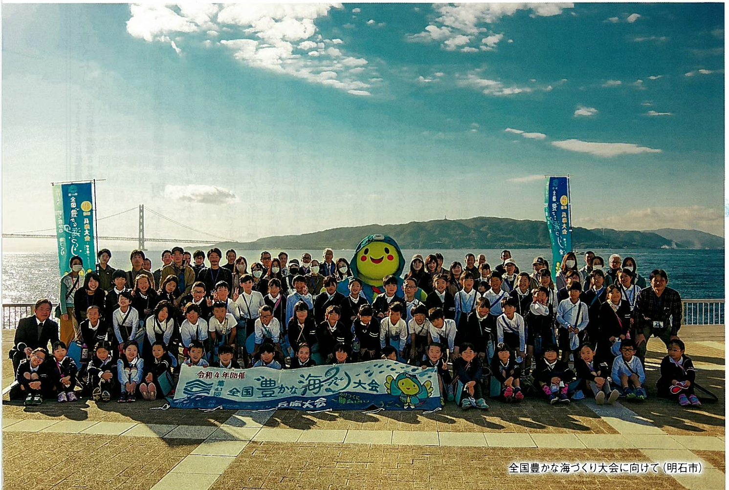
全国豊かな海づくり大会に向けて(明石市)