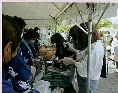
わかめ詰め放題に挑戦

◆007『ロシアより愛をこめて』でボンドがロシア人に傷つけられ意識不明になる。ナイフにフグ毒が塗ってあった。物語の展開に左程に影響しないため、映画化では省略されたが作者はかなり調べて書いている。フグ毒は神経や骨格筋を麻痺させ、食べると20分程で症状がでる。初め唇が少し痺れ、手足が麻痺して動けず、呼吸困難となり窒息する。死ななければ麻痺は回復し後遺症も殆ど残らない。薄くそぎ切りし、大皿に菊やボタンの花卉に見立てて並べ、透して皿の絵が見える。美味しさと劇毒を、併せ持つフグが愛され妖しい魅惑が感じられる。アラ何トモナヤきのふは過ぎて河豚汁(芭蕉)フグ文化万歳である。