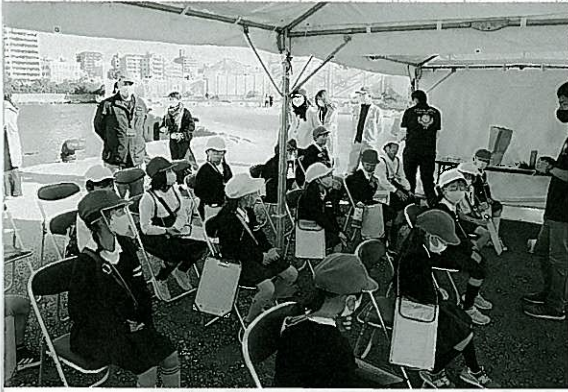
豊かな海についての座学

令和4年秋の大会本番に向けて、県内各浜、河川等で大会記念リレー放流が順次開催されます。