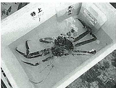
初セリで250万の値が付いた松葉ガニ