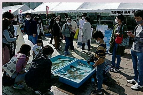
タッチングプールの様子

今後も、観光客の動向など、これまでに実施したアンケート結果を参考にして、淡路島の食材や地域の重要な産業である一次産業を広くPRする活動へ結び付けていきます。