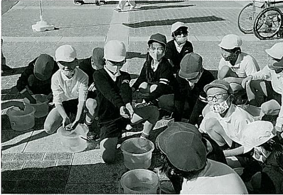
マダイの稚魚を興味深く観察