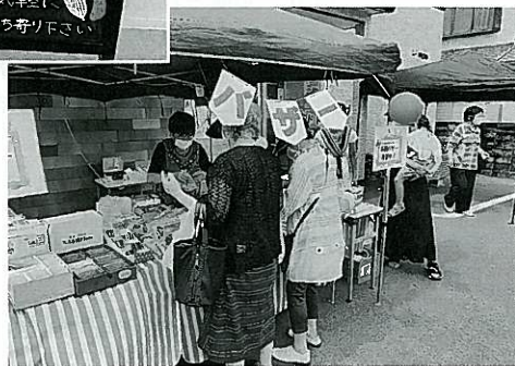
初めての方も多くご来場いただきました