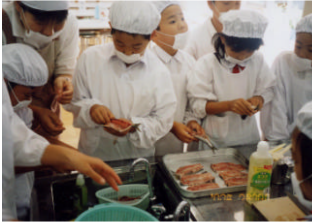
イワシの手開き料理教室

手開きしたイワシのかば焼きを実習、5・6年生は包丁片手に燧灘の小型定置網で漁獲されるハギ、シタビラメ、クロダイ等の捌き方を実習した。児童達は日頃家庭では魚の調理などしたことがないと言いながらも積極的に取り組み、講師の指導のもと上手に捌いていた。かば焼きの調理は、教職員の指導で上手くできる者もあれば、火が強過ぎて焦がしたり、上手くひっくり返せずバラバラにしてしまったりと散々な者もいたが、何とか無事に終了した。出来上がったかば焼きは給食に出され、全員が美味しい美味しいと大喜びで食べていた。