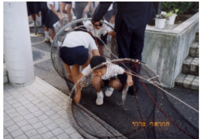
定置網の袋網で遊ぶ子供たち

五郷小学校は、全校生徒数54名、教職員11名と小規模校であったため、65名全員を対象に開催した。今回は、第3校時に地元漁業の紹介としてミニチュアの小型定置網を校庭に設置し、魚の獲れる仕組みや魚種等を説明し、漁業に関する質疑を行った。児童達は、一度網に入った魚が外に出られない網の工夫に感心すると共に、「網に入った魚は全て逃げることなく獲れるのか」「網を使った漁業の種類は他にどのようなものがあるのか」等、多くの質問がでた。この後、網の中を魚になったつもりで歩いてもらい、最後に袋網に入る疑似体験をもらった。児童達はこの体験に大喜びで「魚の気持ちがわかる」とか「私はどんな種類の魚なのかな」などと口々に話し合っていた。