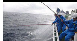
漁業実習(5月22日 本州東方海域)