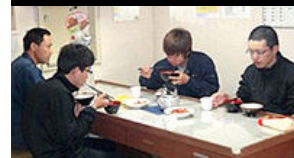
教官との食事(午後5時の夕食)