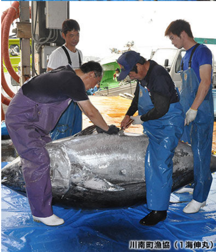
川南町漁協（1海伸丸）