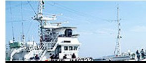
今年5月実習航海出港風景(油津港)

これまでにみやざき丸には数多くの県立高等水産研修所の研修生が実習で乗り込み、現在、その研修生の多くが大海原で活躍しています。水産業を取り巻く環境は厳しいものがありますが、明日の宮崎の水産業を切り拓くためには、漁をしてくれる次世代の漁業従事者が必要です。みやざき丸での実習航海の経験が、少しでも、そんな若者達の背中を押すお役に立てればと、みやざき丸船員一同心から願っております。