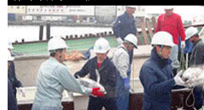
最後の水揚げ作業(清水港にて)