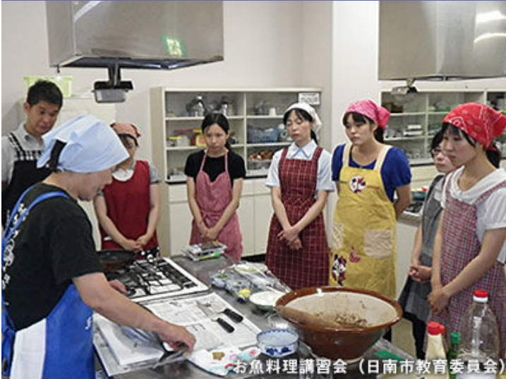
お魚料理講習会（日南市教育委員会）