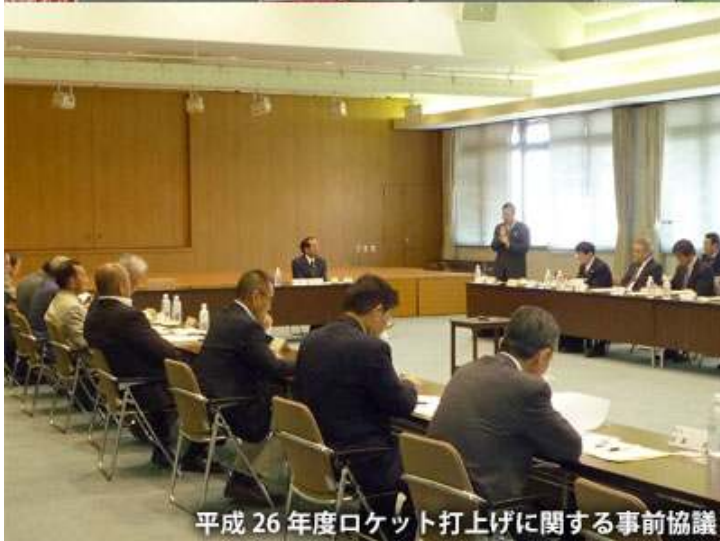
平成 26 年度ロケット打上げに関する事前協議