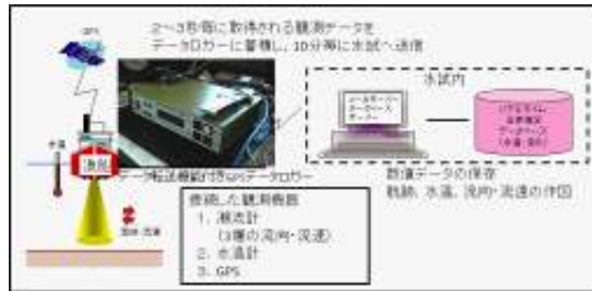
図1:漁船情報集積システムの概略図

水産試験場では、操業の効率化による収益性の向上を目的に、漁業者が漁場を推測したり、効率的な網や縄の入れ方を決定する上で重要な要因の海水温や潮流などの情報(海況情報)を、HPやFAXなどで提供する業務を行ってきました。これまでの衛星情報や海洋観測による海況情報の提供では、晴天時のみに限定され、情報提供の頻度が少なかつたりと、漁業者が求める漁場付近での細かい情報、毎日の情報にこたえられていませんでした。また水温、潮流、黒潮などの情報を別々に確認する必要があり、使い勝手が良いとは言えませんでした。