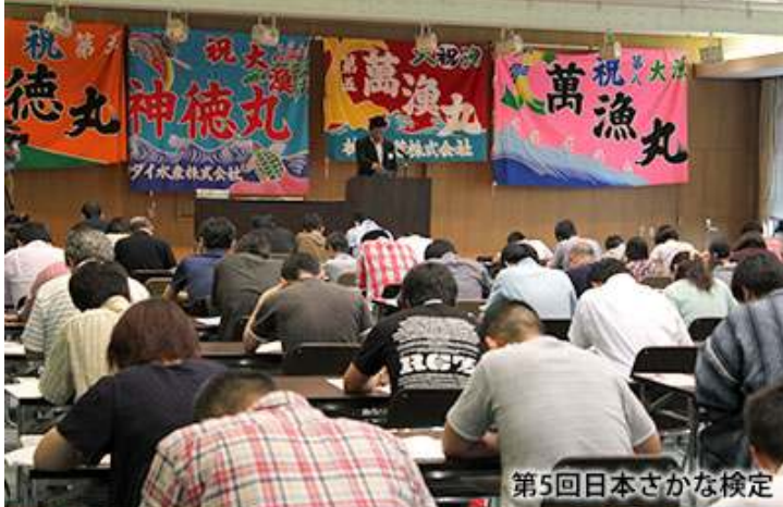
第5回日本さかな検定