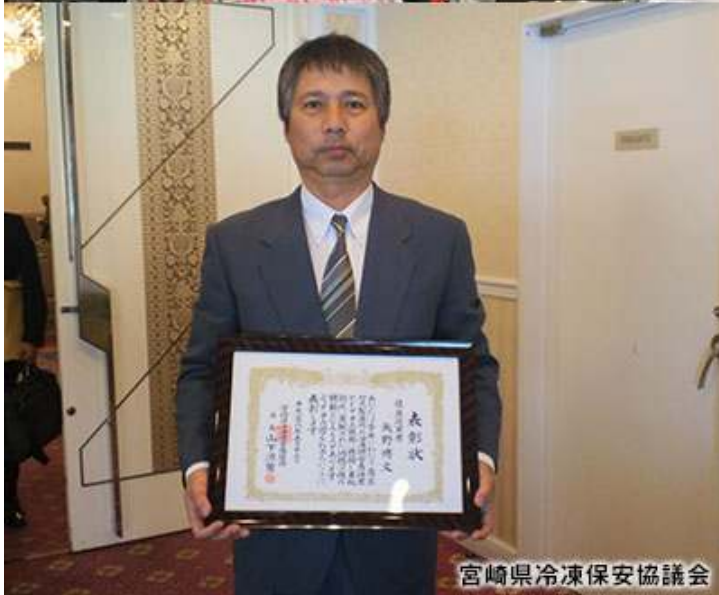
宮崎県冷凍保安協議会