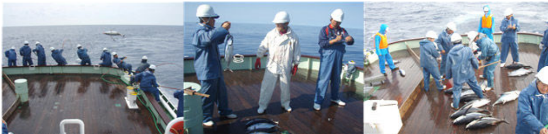
東沖カツオ・ビンナガ漁場調査状況

カツオ・ビンナガ漁業調査試験では、周年にわたり漁場探索を実施しており、日本近海のカツオ・ビンナガの漁場の推移を調査し、漁期始めや漁場形成の予想箇所を調査し、業界船に魚の種類・大きさ・群れの大きさと種類(鳥付の群れなど)調査結果の情報を提供しております。みやざき丸では、「高度漁海況情報システム」や衛星画像を取り込んで解析し、漁場を予測できるシステムを利用した漁場予測による調査試験を行い、業界船の効率的な操業の実現に取り組んでおります。