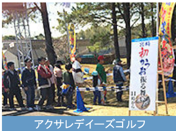
アクサレディースゴルフ