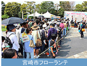
宮崎市フローランテ