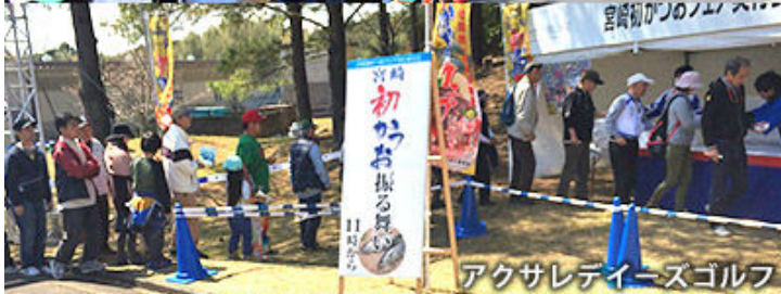
アクサレディースゴルフ