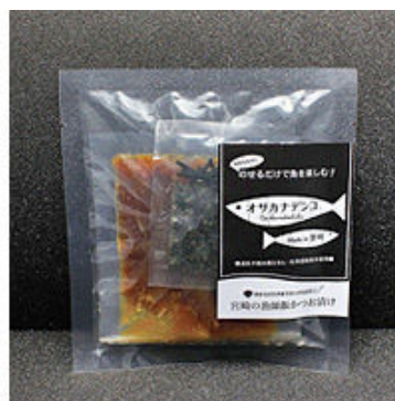
漁師さんのカツオ漬け丼の素