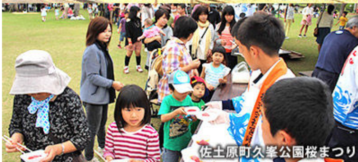
佐土原町久峯公園桜まつり