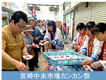
宮崎中央市場カンカン祭