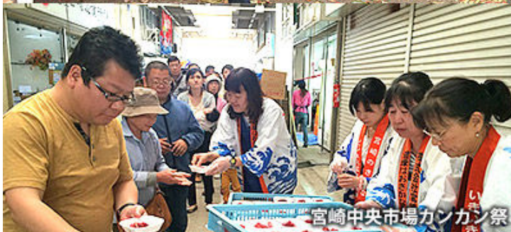
宮崎中央市場カンカン祭