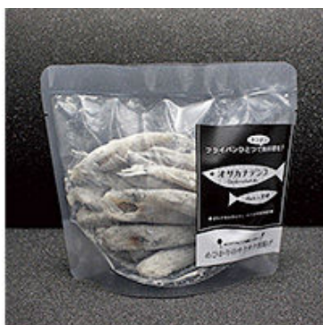
めひかりのサクサク唐揚げ