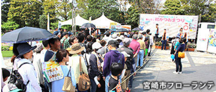
宮崎市フローランテ