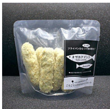
ごろごろマグロのおからコロッケ