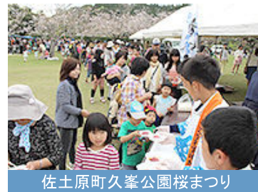
佐土原町久峯公園桜まつり