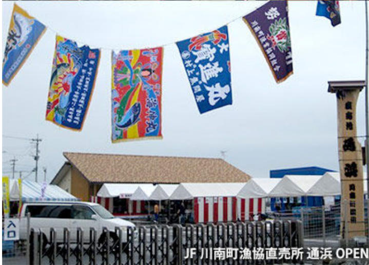
JF川南町漁協直売所 通浜 OPEN