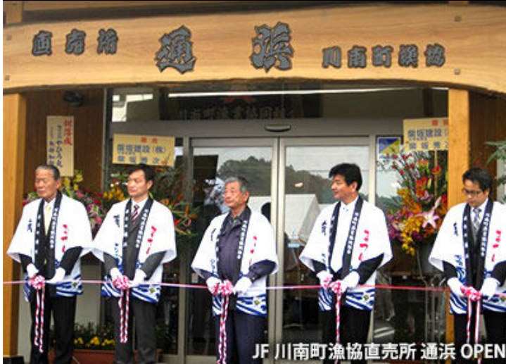
JF川南町漁協直売所 通浜 OPEN