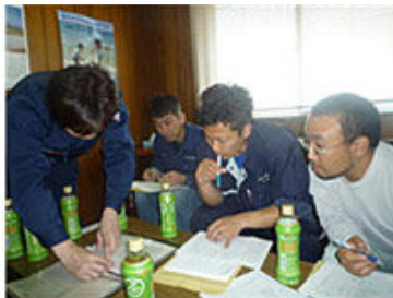
係数表にて算出中。