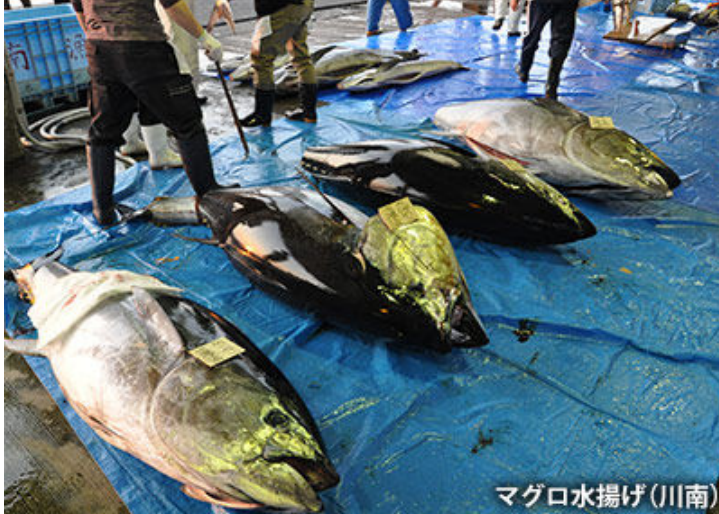
マグロ水揚げ(川南)