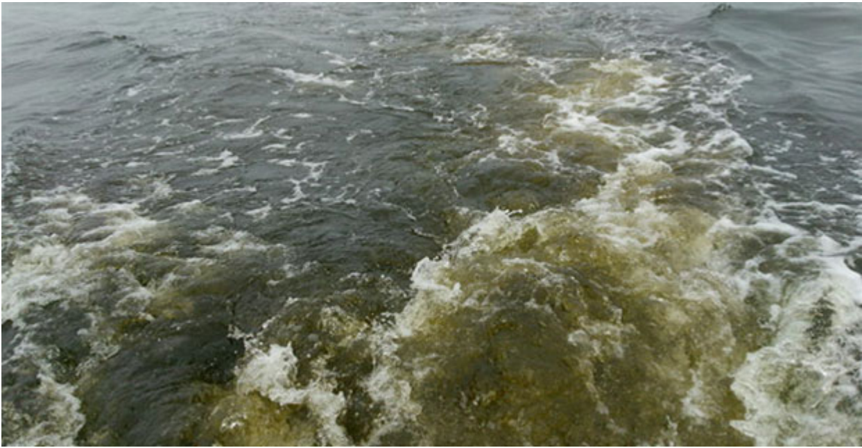
写真1 カレニアによって海面が着色した様子

カ レニアによって海面が着色する様子を写真1に示しました。カレニアは渦鞭毛藻の一種で、魚介類に対して非常に強い毒性を持つことが知られています。1,000細胞/mL以上になると魚がへい死することがあるほか、アワビ類は100細胞/mLという低密度でもへい死することがあります。比較的日照、低塩分で増殖することが多いものの、本種がどのように赤潮を形成するのかはまだはっきりと分かっていません。このため、当試験場では、近隣海域からのカレニアの流入を監視するため、瀬戸内海区水産研究所や近隣県等と共同で、有害プランクトンのモニタリング（「豊後水道周辺漁場モニタリング」）を行っています。その結果、瀬戸内海西部～豊後水道の広範囲におけるカレニア赤潮の発生から消滅までの様子が少しずつわかってきました。