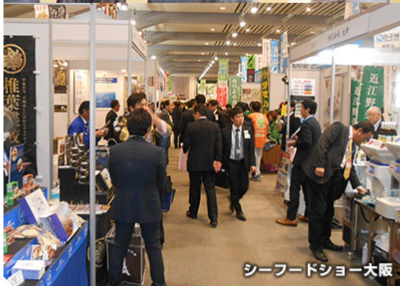
シーフードショー大阪