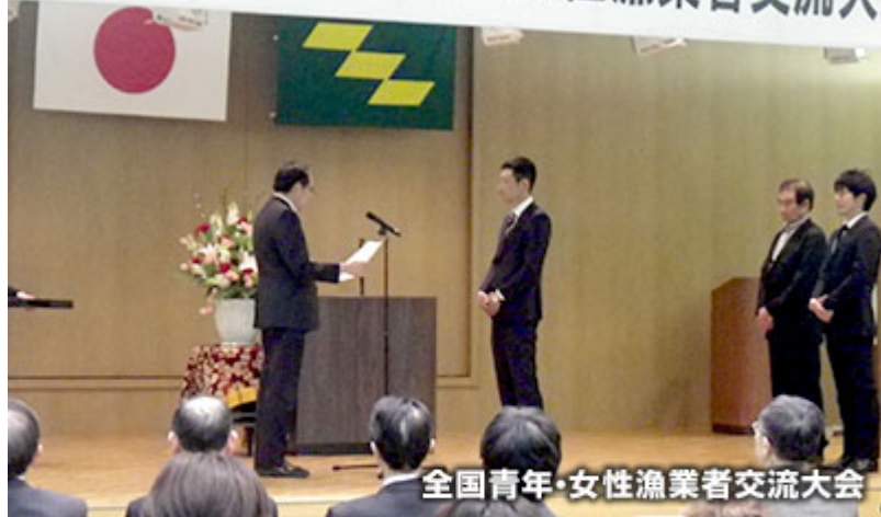
全国青年・女性漁業者交流大会