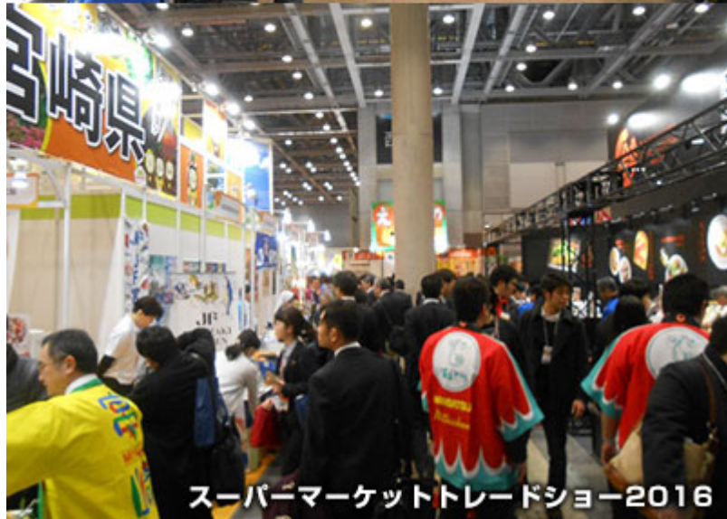
スーパーマーケットトレードショー2016