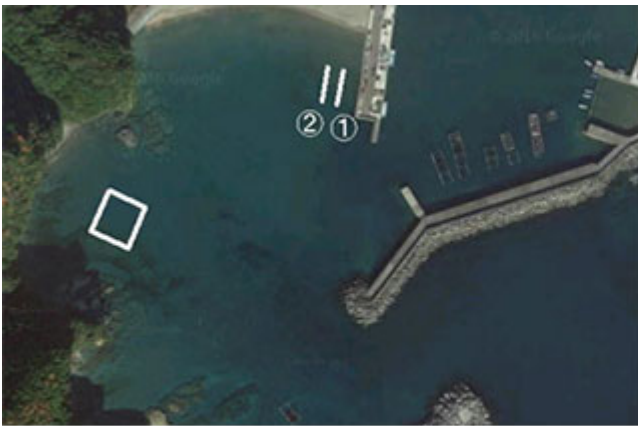
図1 直海地区の設置場所 (□内H26年度設置場所)

なお、直海地区、目井津地区の①及び②の試験養殖期間中の水温をデータロガーを用いて1時間おきに計測しました。