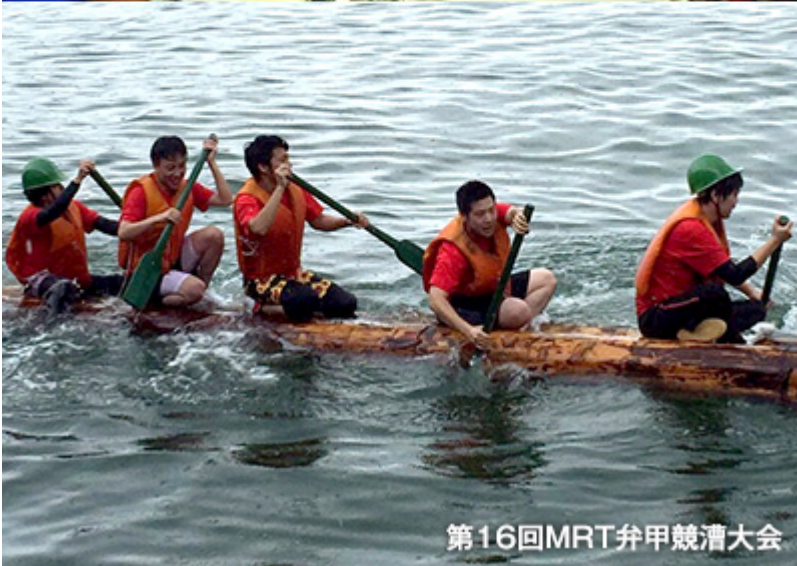
第16回MRT弁甲競漕大会