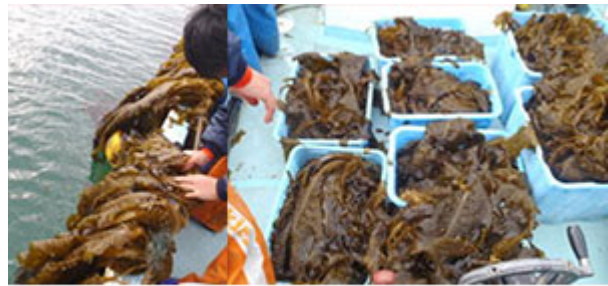
図5 直海地区の収穫作業の様子

直海地区の収穫状況は試験区間による差はなく、ほぼ減耗はなく生残しており、平均藻体長は99cmでした。合計の収穫量は336kgであり、破棄分の15kgを除いた321kgが販売可能と思われました(図5)。