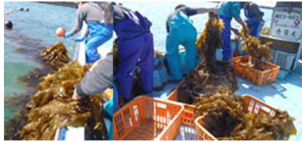
図6 目井津地区の収穫作業の様子

目井津地区の収穫状況は試験区間において、生残に差があり、①の人工植物区で9割程度、①の対照区では0割、②の両区ではほぼ全て生残し、①の人工植物区では食害魚の食痕が多く確認されました。平均藻体長は、①の人工植物区で50cm、②のモール区で71cm、対照区で76cmでした。合計の収穫量は149kgであり、破棄分の7kgを除いた142kgが販売可能と思われました(図6)。