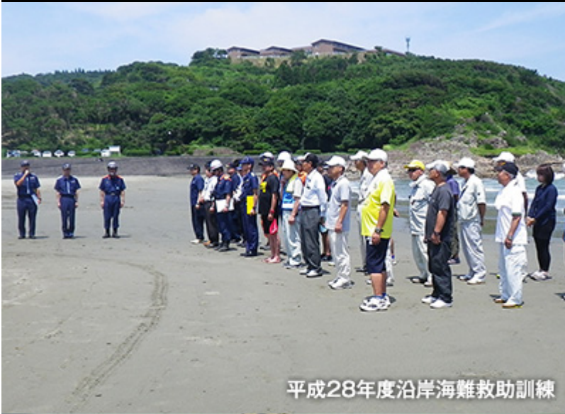
平成28年度沿岸海難救助訓練