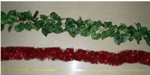
図3 上:園芸用人工植物 下:装飾用モール