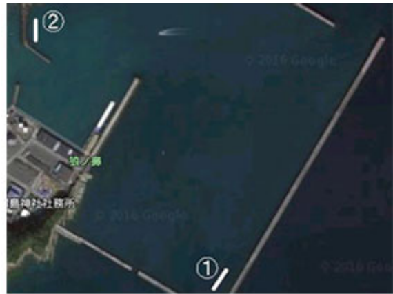
図2 目井津地区の設置場所 (H26年度と同様)