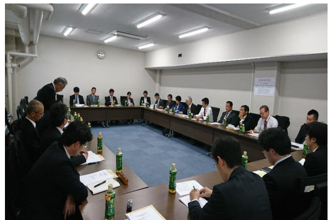
・水産庁との勉強会