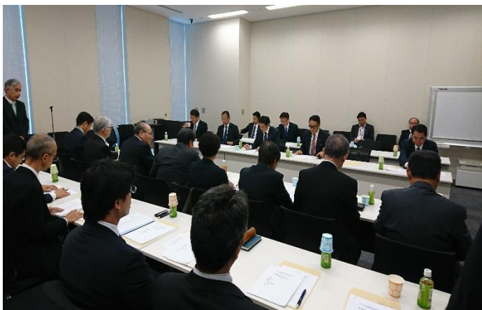
・国会議員との意見交換会

本年はかつお一本釣り漁において、春先からの不漁、昨年来の価格低迷に加え、さらにはビンナガ漁が大不漁となり、大幅に水揚げ金額が減少していることを説明し、持続的経営支援対策についての要望書を提出した。