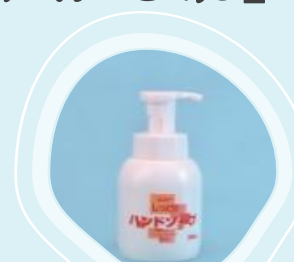
わかしお しっとり ハンドソープ

押すだけでたっぷりの泡になるハンドソープです。トレハロース配合でしっとりとした洗い上がり。