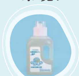
わかしお 洗濯用液体せっけん