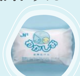
わかしお 浴用石けん