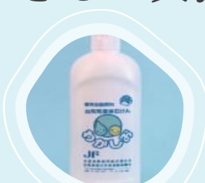
わかしお 台所用液体石けん