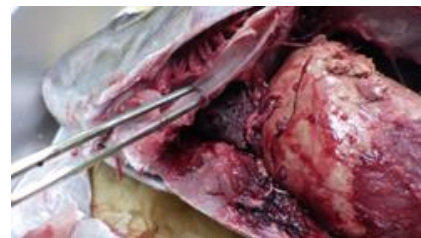
写真4：カンパチαレンサ病魚（心外膜炎）

現在、αレンサに対しては、ワクチン接種及び抗菌剤使用により対策を行っている状況ですが、ここで予期せぬ事態が起きます。