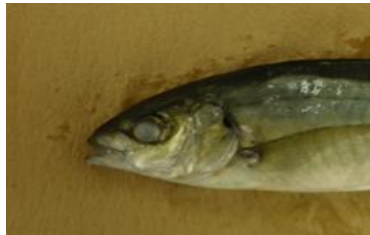
写真3：マアジαレンサ病魚（眼球白濁）