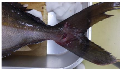
写真2：カンパチαレンサ病魚（尾丙部潰瘍）