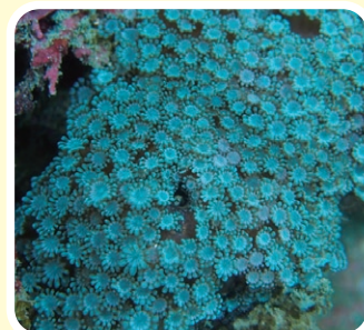
■ニホンアワサンゴ